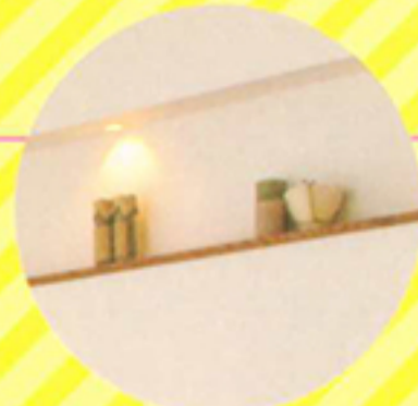
B キッチン前ニッチ (壁埋め込み棚)